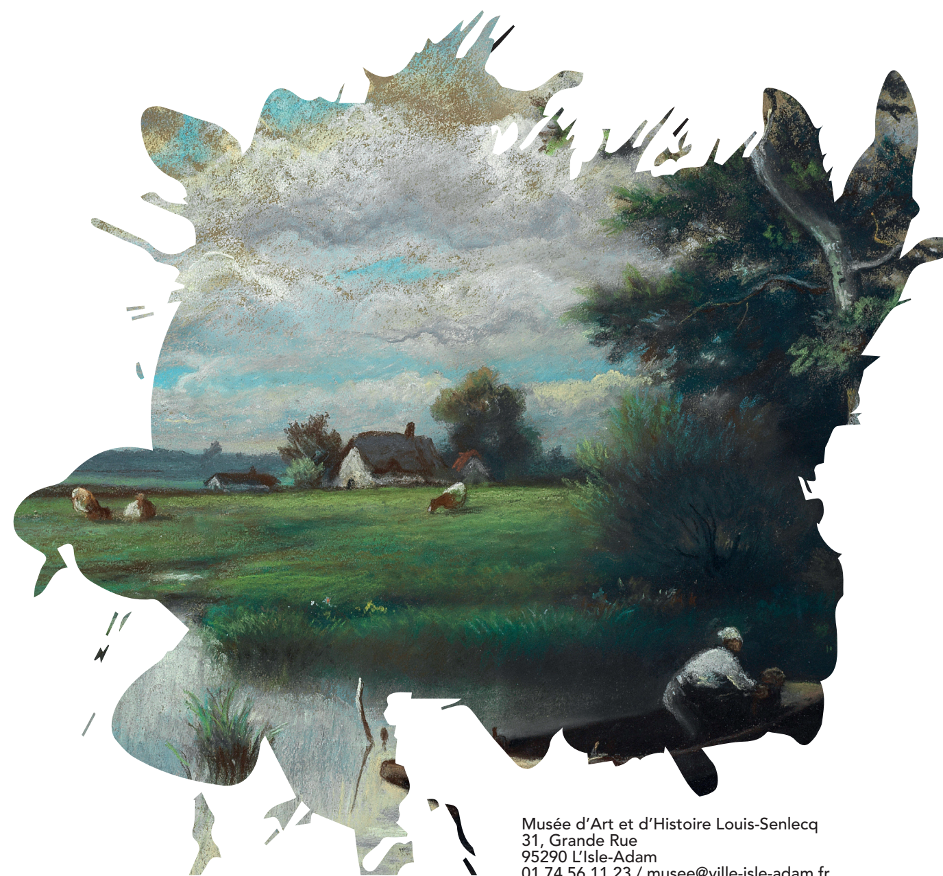
Jules DUPRÉ Le Pêcheur , entre 1860 et 1870 Pastel sur papier marouflé sur toile (détail) L'Isle-Adam, musée d'Art et d'Histoire Louis-Senlecq

Jules Dupré a un rôle déterminant dans l'histoire de la peinture de paysage au XIX ème siècle. Sous son pinceau la touche se libère et il n'est plus question de fidélité absolue à la nature mais de peinture pure, de couleurs, de lumière et d'émotion. Tout comme ses amis, Corot et Daubigny, Jules Dupré influencera les jeunes peintres impressionnistes.