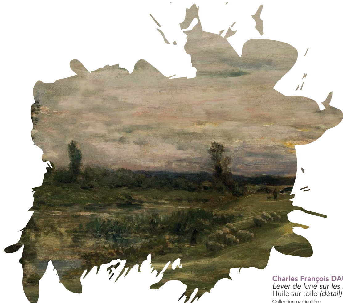
Charles François DAUBIGNY Lever de lune sur les bords de l'Oise Huile sur toile (détail) Collection particulière