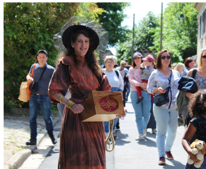
La compagnie "Chut et la Gollut" a accompagné les visiteurs jusqu'au jardin de la Maison-Atelier de Daubigny pour un déjeuner sur l'herbe. Ambiance guinguette comme au temps des impressionnistes !