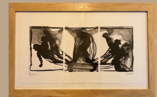
"8 anges" 50x27,5 cm numérotée et signée