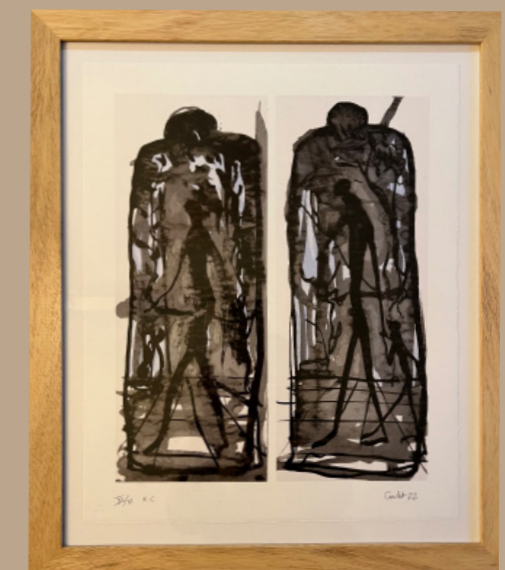
"La Sainte famille" 45,5x37 cm numérotée et signée

Merci de déposer en Mairie le bulletin de réservation accompagné de votre chèque à l'ordre de l'association, TOURNESOLS-D'UKRAINE. Vous recevrez un accusé de réception et un bon pour don. Votre lithographie est disponible en Mairie dès réception de votre règlement.